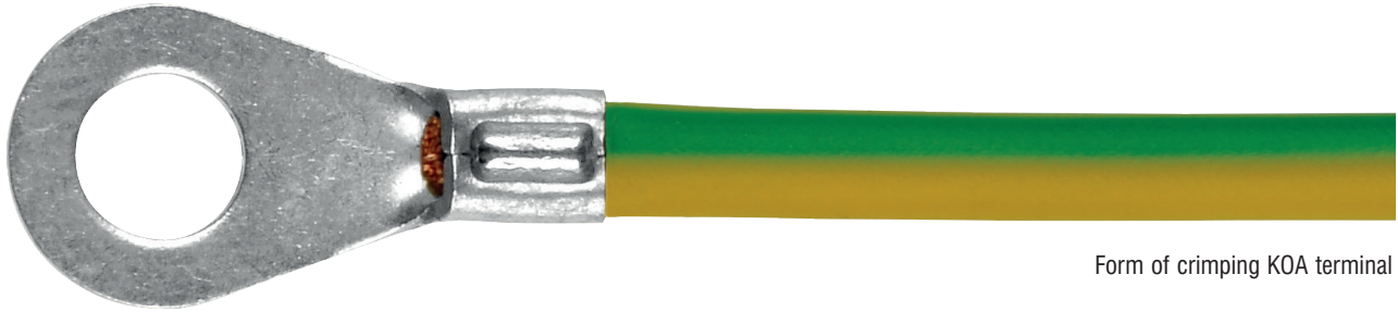
Form of crimping KOA terminal