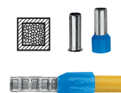
Form of crimping on wire.