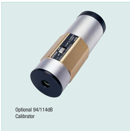
Optional 94/114dB Calibrator