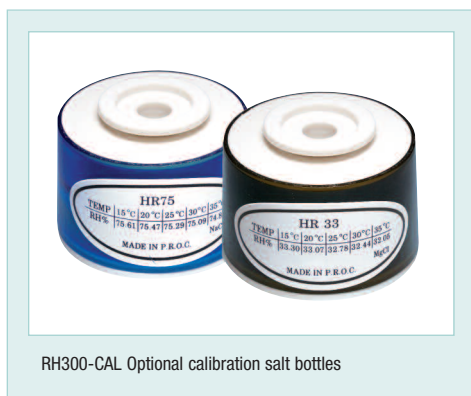
RH300-CAL Optional calibration salt bottles