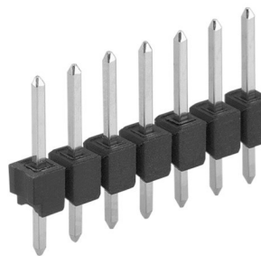
PCB connectors>Male headers one row, □ 0.635 mm