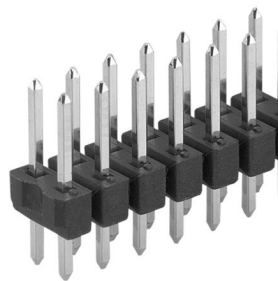
PCB connectors>Male headers two rows, \square 0.635 mm