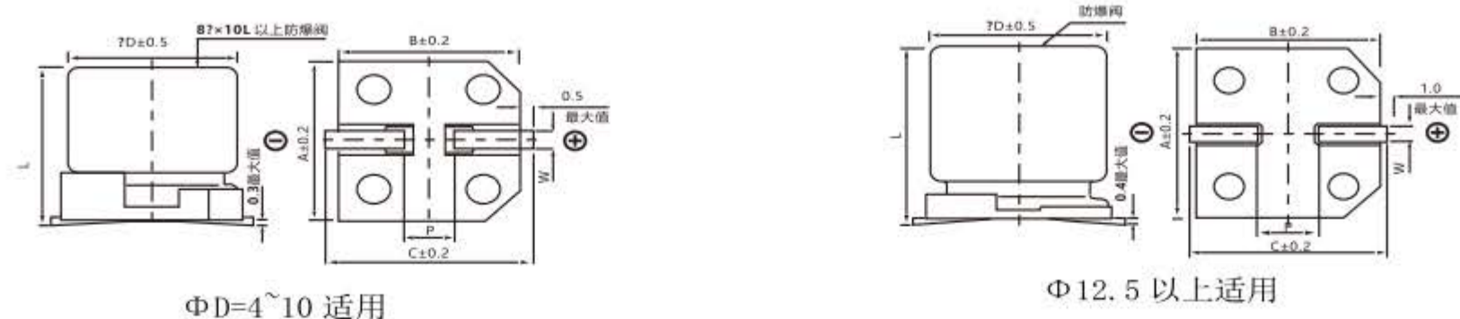
Diagram of Dimensions 尺寸图