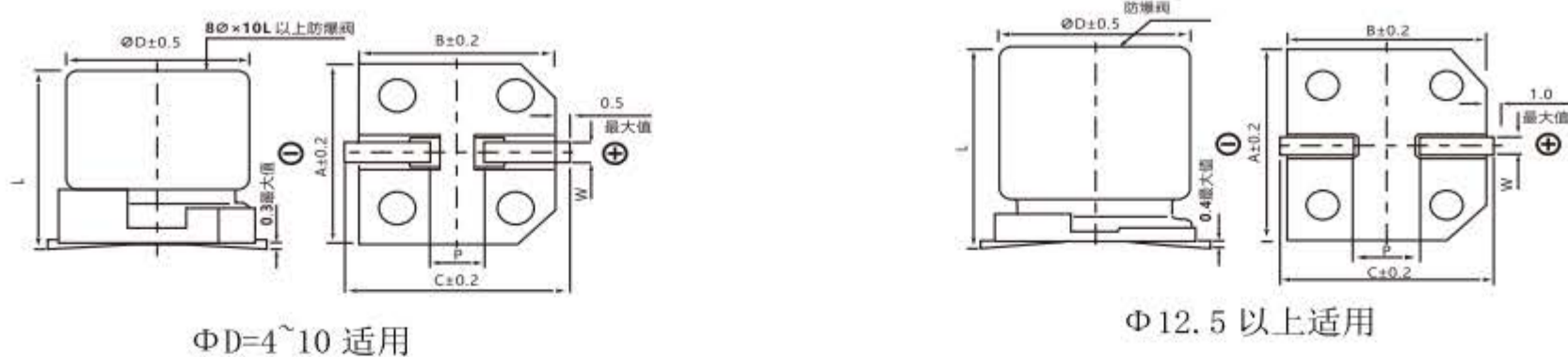
Diagram of Dimensions 尺寸图