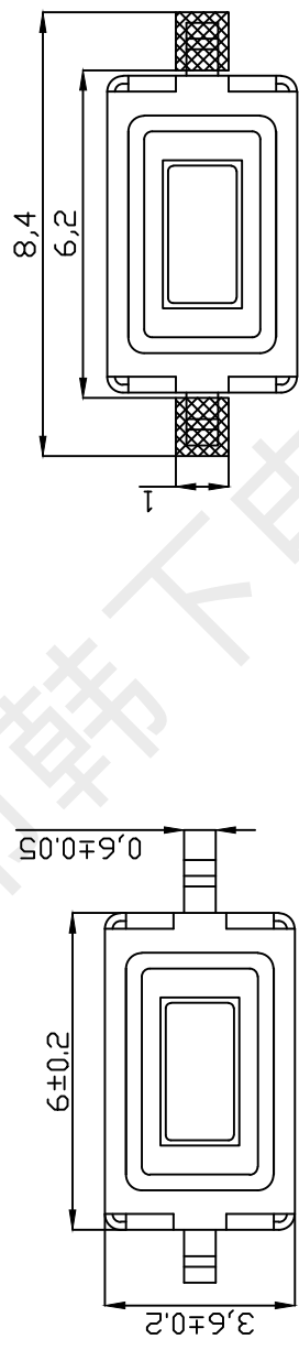
PCB. 焊接图 PCB. WELDING DRAWING