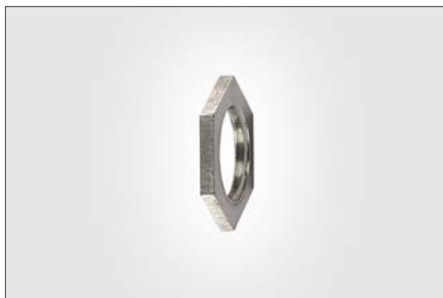
HelaGuard ALS Plated Steel Locknuts.

The ALS hexagonal locknut is used to secure fitting.