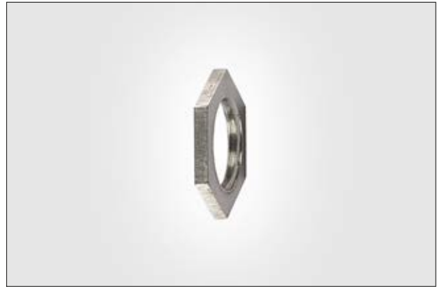
HelaGuard ALSS Stainless Steel Locknuts.

The ALSS hexagonal locknut is used to secure fitting.