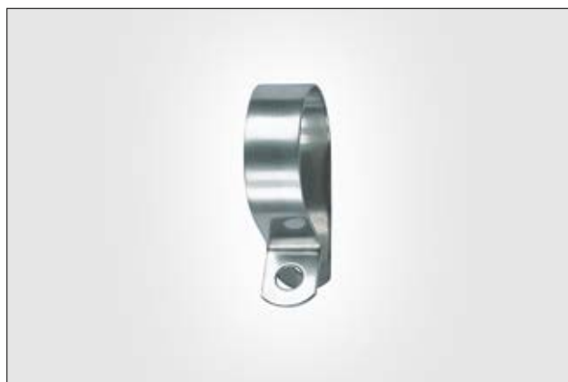
HelaGuard AFCSS Fixing Clip, Stainless Steel.

The AFCSS P-clip is used to secure metallic conduits.