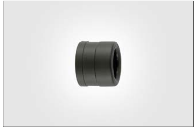
HelaGuard PAEC End Cap.