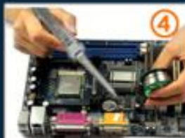
4.焊接（达到温度则可融化 焊锡丝，需另取焊锡丝）