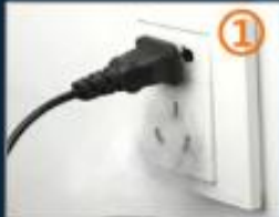
1.插上电源线预热 初次使用需预热