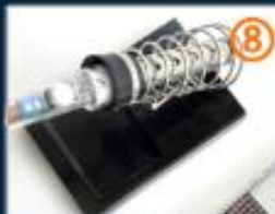
8.不用时放冷却后再收起来