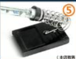
5.暂时不用可放到海绵烙铁架上