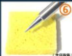
6.烙铁头上有杂质，在高温 海绵上清洗一下。