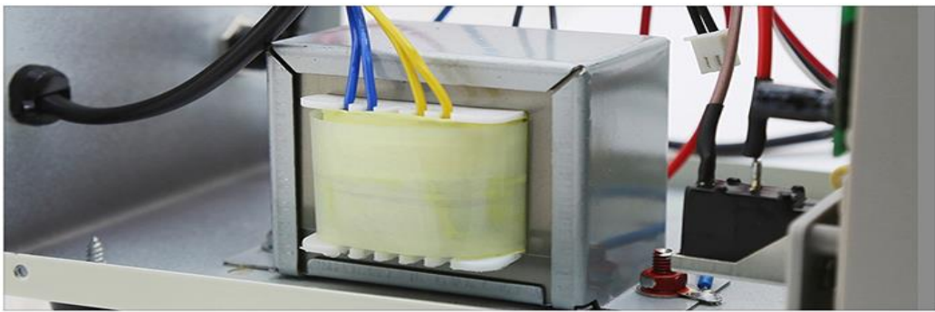
▲ 大功率纯铜线变压器