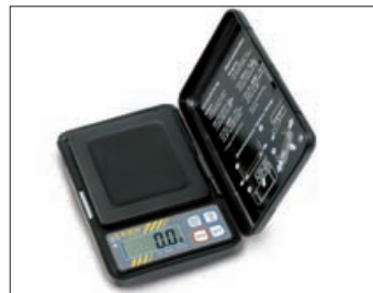
KERN TEB · CM · CM-C