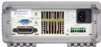
E3640A – E3645A