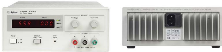
E3610A – E3617A