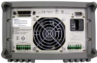
E3646A – E3649A