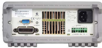
E3640A – E3645A