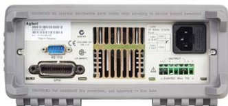
E3640A – E3645A