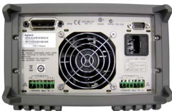
E3646A – E3649A