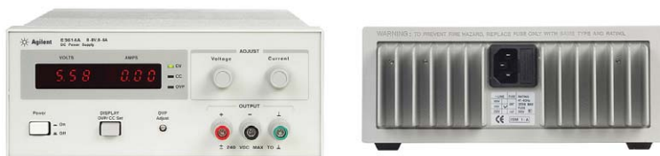
E3610A – E3617A