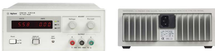
E3610A – E3617A