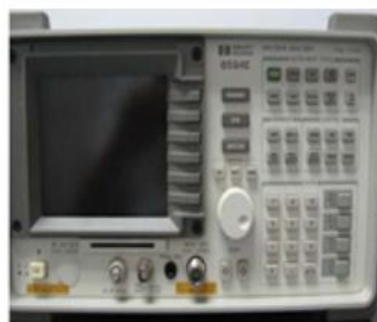
HP 8594E 频谱分析仪