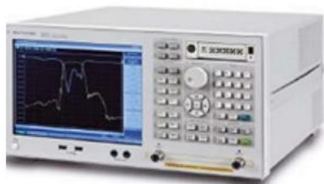
安捷伦 E5071C 网络分析仪