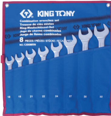
► MRN / SRN : Teton pouch bag