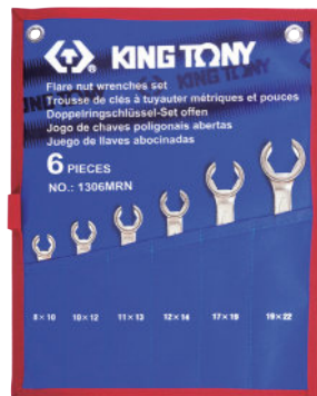
► MRN / SRN : Tetonon pouch bag