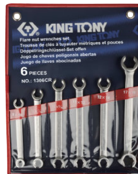
► MR / SR : Nylon pouch bag