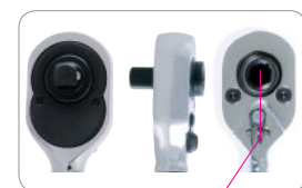
magnet 276A-04G (top, side, back)