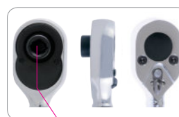
magnet 2765-04G (top, side, back)