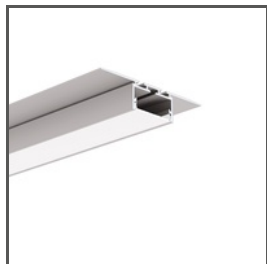
GIZA-LL-T A02479 Ref. arch C2479