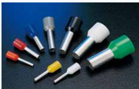
1506 歐式端子 CORD END TERMINAL