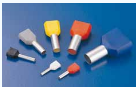
1506 雙線套歐式端子 TWIN CORD END TERMINAL