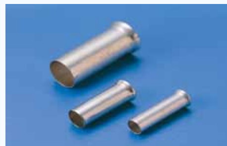
1506 歐式裸端子 NON-INSULATED CORD END TERMINAL