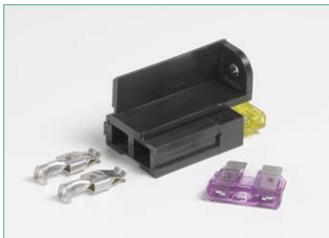
Dimensions in mm / Maße in mm