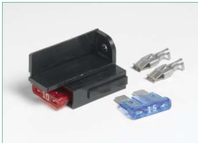
Dimensions in mm / Maße in mm