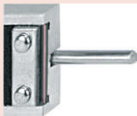
Jauge de profondeur ronde pour petits alésages