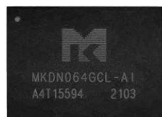
Nano SD NAND(12.5*9mm)