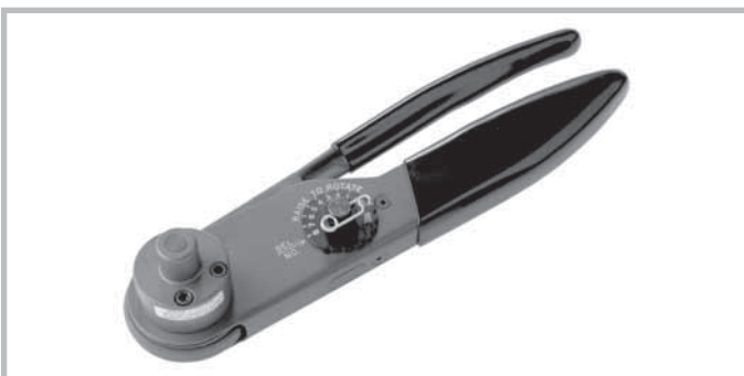
Hand crimp tool for high power contacts. Tool order number: M309 Positioner for plug: TP1071-1 Positioner for receptacles: TP1072-1 Positioner for plugs and receptacles: SP994

Handcrimpzange zum Crimpen von Koaxialkontakten (Innenleiter). Werkzeugbestellnummer: M22520/2-01