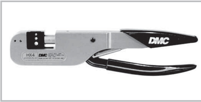
Hand crimp tool for coaxial contacts (outer conductor). Tool order number: M22520/5-01

Handcrimpzange zum Crimpen von Koaxialkontakten (Außenleiter). Werkzeugbestellnummer: M22520/5-01