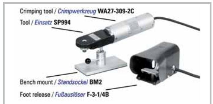
Pneumatic crimp tool for high power contacts. Tool order number: WA27-309-2C with foot release BM-2 (bench mount) SP994 (positioner) TP1071-1, TP1072-1 (positioner)

Handcrimpzange zum Crimpen von Hochstromkontakten. Werkzeugbestellnummer: M309 Einsatz für Stecker: TP1071-1 Einsatz für Steckdosen: TP1072-1 Einsatz für Stecker und Steckdosen: SP994