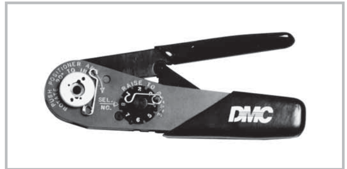
Hand crimp tool for coaxial contacts (inner conductor). Tool order number: M22520/2-01

Einsatz für Crimpwerkzeuge. Bestellnummer: Y1535P