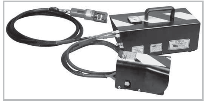
Pneumatic crimp tool for coaxial contacts (outer conductor). Tool order number: PH4001 PH4002 (with foot release)

Handcrimpzange zum Crimpen von Koaxialkontakten (Außenleiter). Werkzeugbestellnummer: M22520/5-01