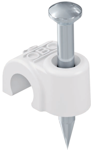
ISO nail clip, short design