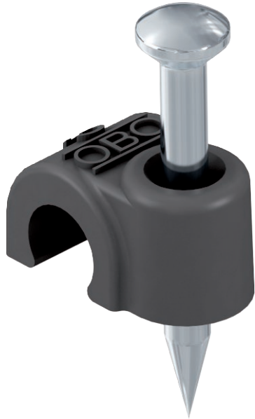
ISO nail clip, short design