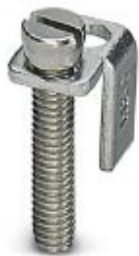
Chain bridge, pitch: 6 mm, number of positions: 1, color: silver

Please be informed that the data shown in this PDF Document is generated from our Online Catalog. Please find the complete data in the user's documentation. Our General Terms of Use for Downloads are valid ( http://phoenixcontact.com/download )