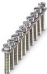
Jumper, pitch: 6 mm, number of positions: 10, color: silver

Please be informed that the data shown in this PDF Document is generated from our Online Catalog. Please find the complete data in the user's documentation. Our General Terms of Use for Downloads are valid ( http://phoenixcontact.com/download )