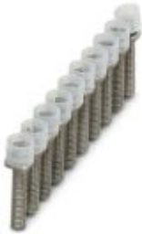
Jumper, pitch: 6 mm, number of positions: 10, color: silver

Please be informed that the data shown in this PDF Document is generated from our Online Catalog. Please find the complete data in the user's documentation. Our General Terms of Use for Downloads are valid ( http://phoenixcontact.com/download )