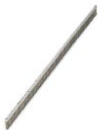
Jumper, number of positions: 100, color: silver

Please be informed that the data shown in this PDF Document is generated from our Online Catalog. Please find the complete data in the user's documentation. Our General Terms of Use for Downloads are valid ( http://phoenixcontact.com/download )