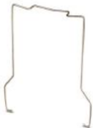
Spring lock, for mechanical locking in the case of overhead mounting, 1-pos.

Please be informed that the data shown in this PDF Document is generated from our Online Catalog. Please find the complete data in the user's documentation. Our General Terms of Use for Downloads are valid ( http://phoenixcontact.com/download )