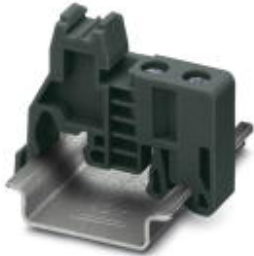
终端紧固件，安装在NS 32或NS 35/7,5 DIN导轨上

Please be informed that the data shown in this PDF Document is generated from our Online Catalog. Please find the complete data in the user's documentation. Our General Terms of Use for Downloads are valid ( http://download.phoenixcontact.com )