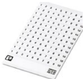
Marker card, self-adhesive, horizontally labeled with the consecutive numbers: 41 ... 50, 10-section marker strips with 12 identical decades, white

Please be informed that the data shown in this PDF Document is generated from our Online Catalog. Please find the complete data in the user's documentation. Our General Terms of Use for Downloads are valid ( http://phoenixcontact.com/download )