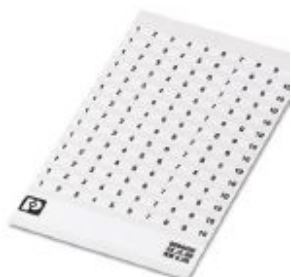
Marker card, self-adhesive, horizontally labeled with the consecutive numbers: 1 ... 10, 10-section marker strips with 14 identical decades, white

Please be informed that the data shown in this PDF Document is generated from our Online Catalog. Please find the complete data in the user's documentation. Our General Terms of Use for Downloads are valid ( http://phoenixcontact.com/download )