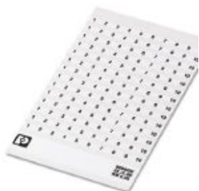
Marker card, self-adhesive, horizontally labeled with the consecutive numbers: 31 ... 40, 10-section marker strips with 14 identical decades, white

Please be informed that the data shown in this PDF Document is generated from our Online Catalog. Please find the complete data in the user's documentation. Our General Terms of Use for Downloads are valid ( http://phoenixcontact.com/download )