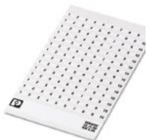
Marker card, self-adhesive, horizontally labeled with the consecutive numbers: 81 ... 90, 10-section marker strips with 14 identical decades, white

Please be informed that the data shown in this PDF Document is generated from our Online Catalog. Please find the complete data in the user's documentation. Our General Terms of Use for Downloads are valid ( http://phoenixcontact.com/download )