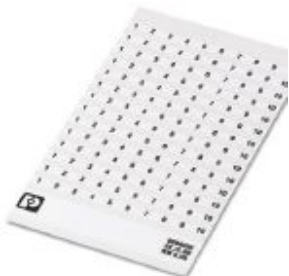
Marker card, self-adhesive, horizontally labeled with the consecutive numbers: 91 ... 100, 10-section marker strips with 14 identical decades, white

Please be informed that the data shown in this PDF Document is generated from our Online Catalog. Please find the complete data in the user's documentation. Our General Terms of Use for Downloads are valid ( http://phoenixcontact.com/download )