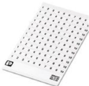
Marker card, self-adhesive, horizontally labeled with the consecutive numbers: 41 ... 50, 10-section marker strips with 12 identical decades, white

Please be informed that the data shown in this PDF Document is generated from our Online Catalog. Please find the complete data in the user's documentation. Our General Terms of Use for Downloads are valid ( http://phoenixcontact.com/download )