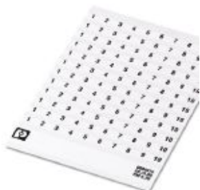
Marker card, self-adhesive, horizontally labeled with the consecutive numbers: 11 ... 20, 10-section marker strips with 12 identical decades, white

Please be informed that the data shown in this PDF Document is generated from our Online Catalog. Please find the complete data in the user's documentation. Our General Terms of Use for Downloads are valid ( http://phoenixcontact.com/download )