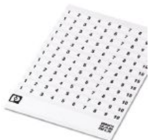
Marker card, self-adhesive, horizontally labeled with the consecutive numbers: 21 ... 30, 10-section marker strips with 12 identical decades, white

Please be informed that the data shown in this PDF Document is generated from our Online Catalog. Please find the complete data in the user's documentation. Our General Terms of Use for Downloads are valid ( http://phoenixcontact.com/download )