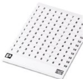
Marker card, self-adhesive, horizontally labeled with the consecutive numbers: 31 ... 40, 10-section marker strips with 12 identical decades, white

Please be informed that the data shown in this PDF Document is generated from our Online Catalog. Please find the complete data in the user's documentation. Our General Terms of Use for Downloads are valid ( http://phoenixcontact.com/download )