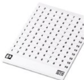
Marker card, self-adhesive, horizontally labeled with the consecutive numbers: 61 ... 70, 10-section marker strips with 12 identical decades, white

Please be informed that the data shown in this PDF Document is generated from our Online Catalog. Please find the complete data in the user's documentation. Our General Terms of Use for Downloads are valid ( http://phoenixcontact.com/download )