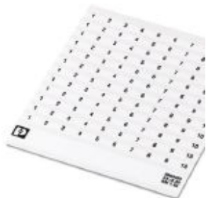
Marker card, self-adhesive, labeled with the consecutive numbers: 21 ... 30, 10-section marker strips with 10 identical decades, white

Please be informed that the data shown in this PDF Document is generated from our Online Catalog. Please find the complete data in the user's documentation. Our General Terms of Use for Downloads are valid ( http://phoenixcontact.com/download )